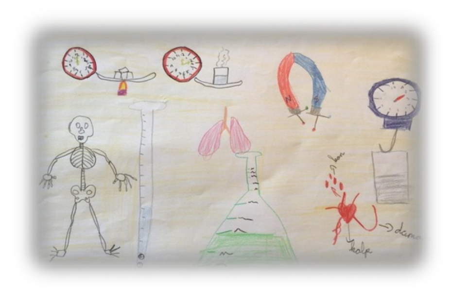
Resim 2. Asya'nın resmi ve açıklaması

Taşkın ve arkadaşlarının yaptıkları çalışmada (2002), idarecilerin % 87,09'u yapılan fen laboratuvarı deney uygulamalarını yetersiz bulduklarını, laboratuvar uygulamalarını öğretim yılı boyunca ortalama hangi sıklıkla yapıyorsunuz? sorusuna, öğretmenlerin %10'u her ders sonu, %16'sı haftada bir, %18'i ayda bir ve %13'ü ise dönemde bir defa diye cevaplamışlardır. Soruya yapmıyorum diye cevap verenlerin oranı %43 olarak saptanmıştır. Öğretmenler laboratuvar çalışması yapmamalarının gerekçesi olarak, kalabalık sınıfları, kırılan veya bozulan malzemelerin temini, derslik yetersizliği, malzeme eksikliği, zaman ve basılı kaynak yetersizliği gibi etkenleri göstermişlerdir (Taşkın, Ekici ve Taşkın, 2002)