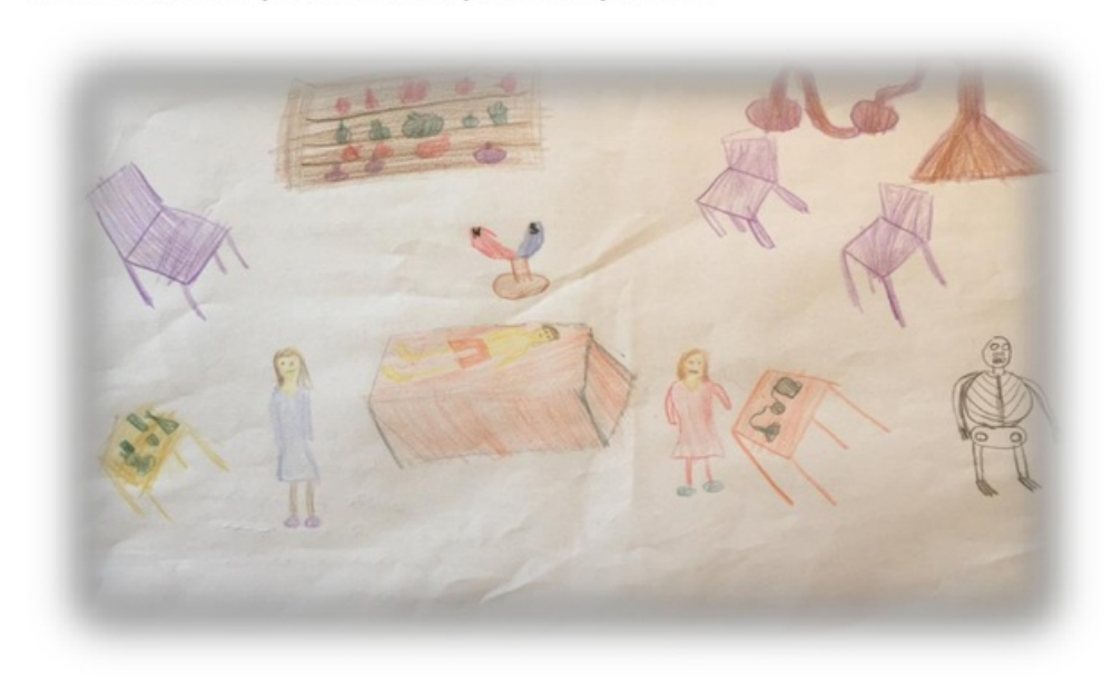
Resim 3. Melike'nin resmi ve açıklaması

Akgün, Çinici, Yıldırım ve Köprübaşı (2015), yaptıkları çalışmaya paralel olarak, yapılan çalışmada öğrencilerin verdikleri örneklerin genellikle ders kitabında bulunan örnekler olduğu gözlenmiştir. Ders kitabında yer almayan ancak öğrencilerin yakın çevresinden daha çok örnekler olmasına rağmen bunların fark edilemediği gözlemlenmiştir. Bu durum öğretmenlerin ders işlerken kitaplara bağlı kalmasından kaynaklanmış bu sebeple öğrenciler ezbere sürüklenmiş olmasından kaynaklanmış olabilir.