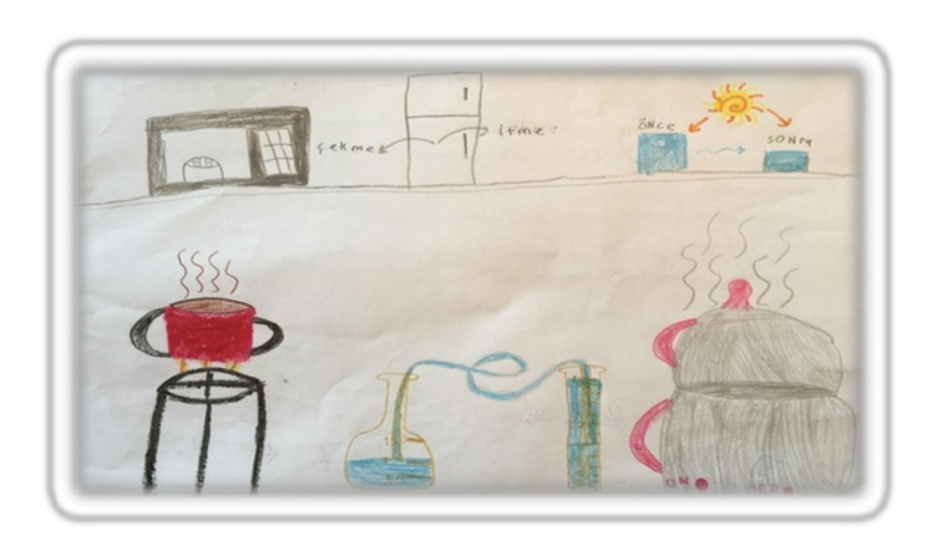
Resim 1.Elif'in resmi ve açıklaması (4.sınıf)

Çocukların büyük bir bölümü yeşil renk ve tonlarını sıklıkla kullanmışlardır. Çocuk resimlerinde yeşil renk genel olarak büyüme ve gelişmeyi ifade etse de koyu yeşil mi açık yeşil mi olduğu da önemlidir. Yani her renk çocuğun yaptığı resimlerde nasıl kullanıldığına bağlı olarak çeşitli anlamlara gelebilir (Malchioldi, 2005).